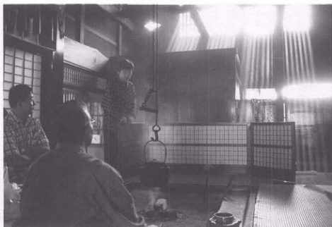
传统建造物群保存地区——妻笼宿“本阵”内景