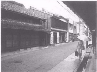
名古屋有松地区街景

(2) 国家在市町村指定的传统建造物群保存地区中, 选定具有较高价值的地区或地区的一部分为全国重要传统建造物群保存地区, 对其保护事业给予必要的财政援助及技术指导, 地方政府、公共团体对此保护事业也给予必要的协助。