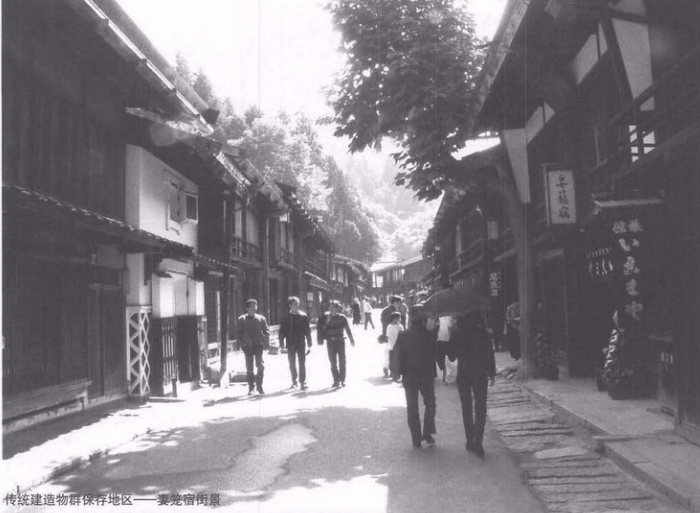
传统建造物群保存地区——妻笼宿街景