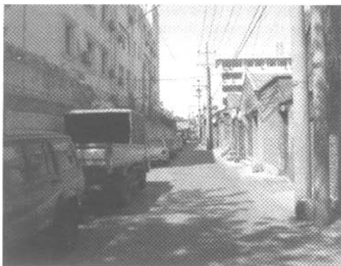
图1 德内地区的护国寺东巷 Fig.1 Eastern lane of Huguo Temple in Deshengmennei blocks