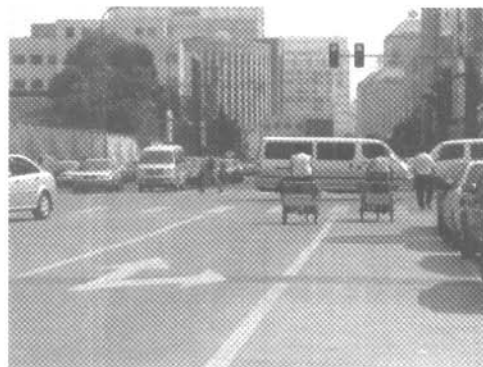
图4 金融街地区改建后的街道、两侧建筑 Fig.4 The upgraded roads and buildings in the finance blocks