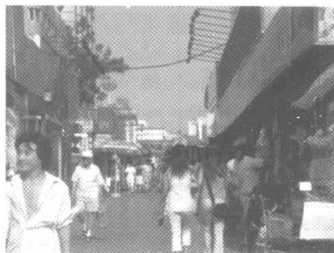
图3 隆福大厦前胡同 Fig.3 Alleys and lanes in front of Longfu Mansion