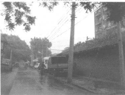
图2 德内地区的护国寺街 Fig.2 Huguo Temple street in Deshengmennei blocks